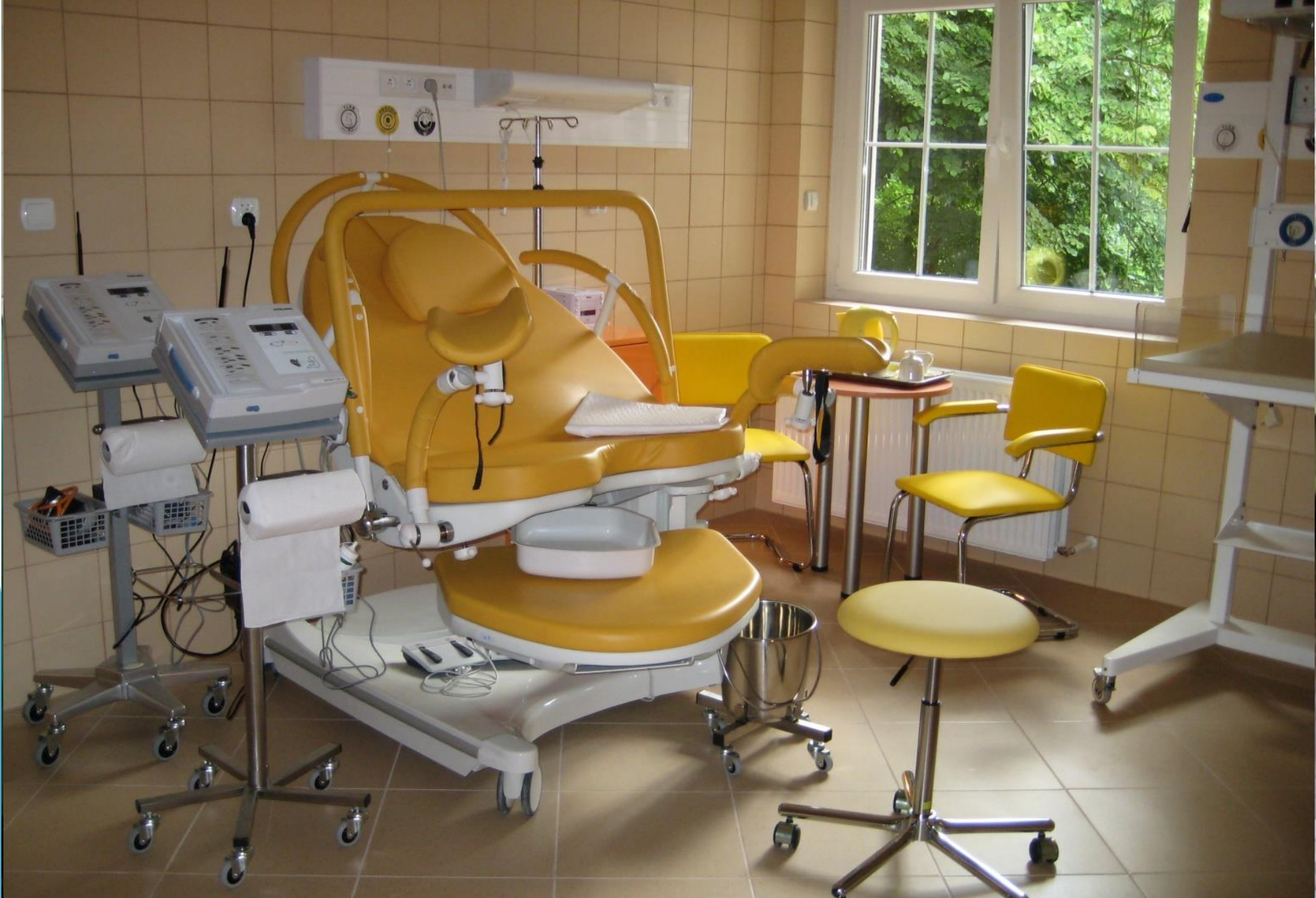
Sala porodowa – przed remontem