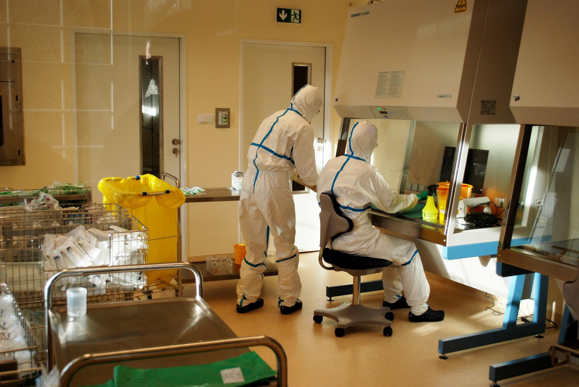
Pracownia Leku Cytotoksycznego