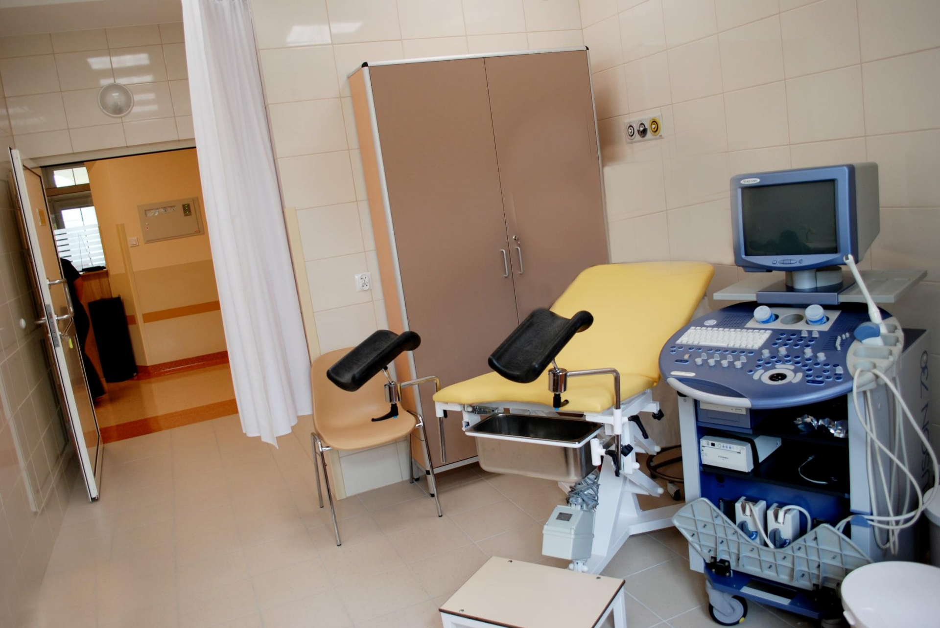
Gabinet zabiegowy Oddziału Ginekologii