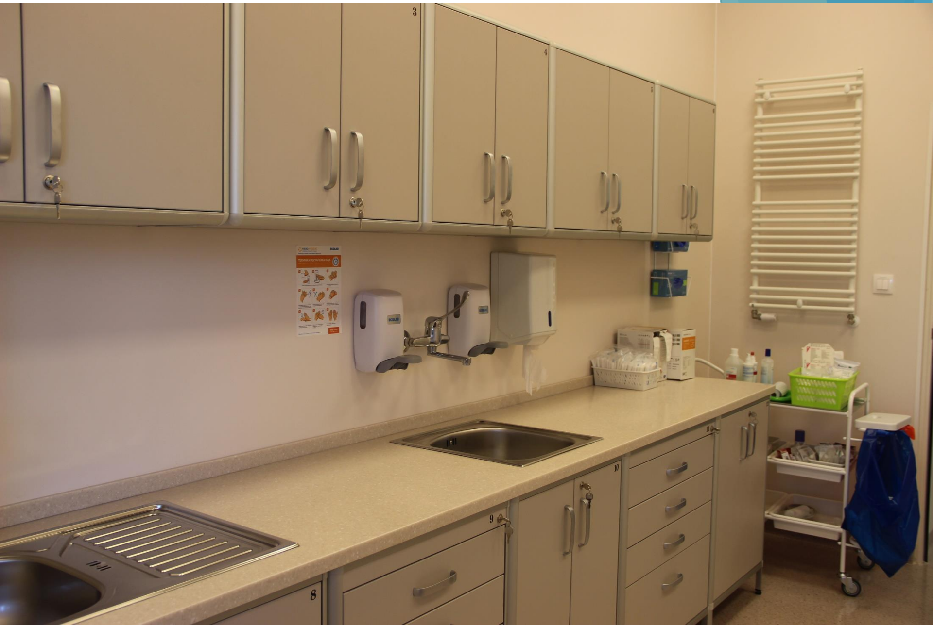
Oddział Chirurgii Urazowej i Ortopedycznej