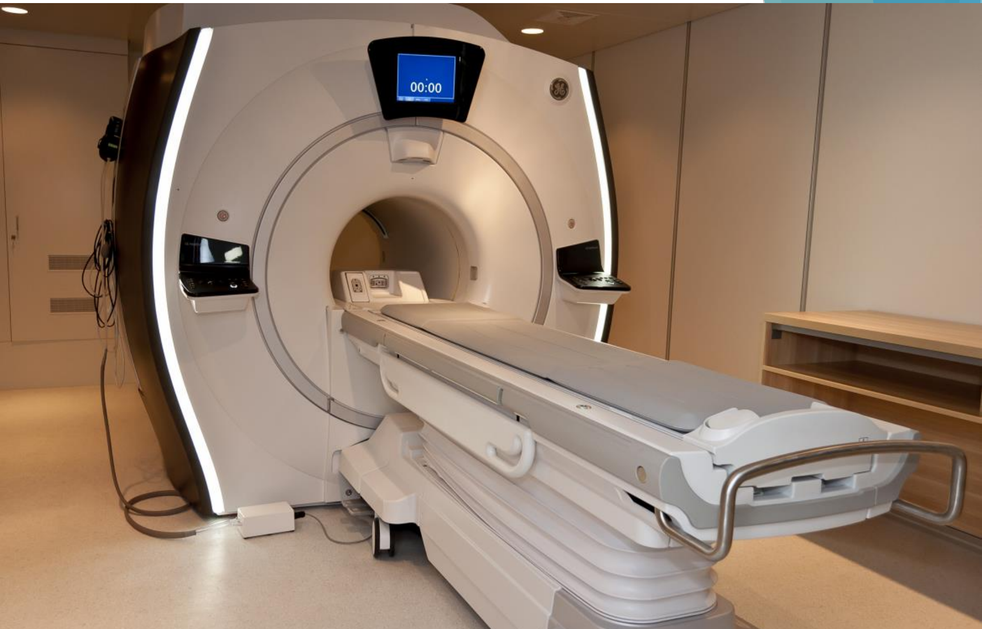
Pracownia rezonansu magnetycznego