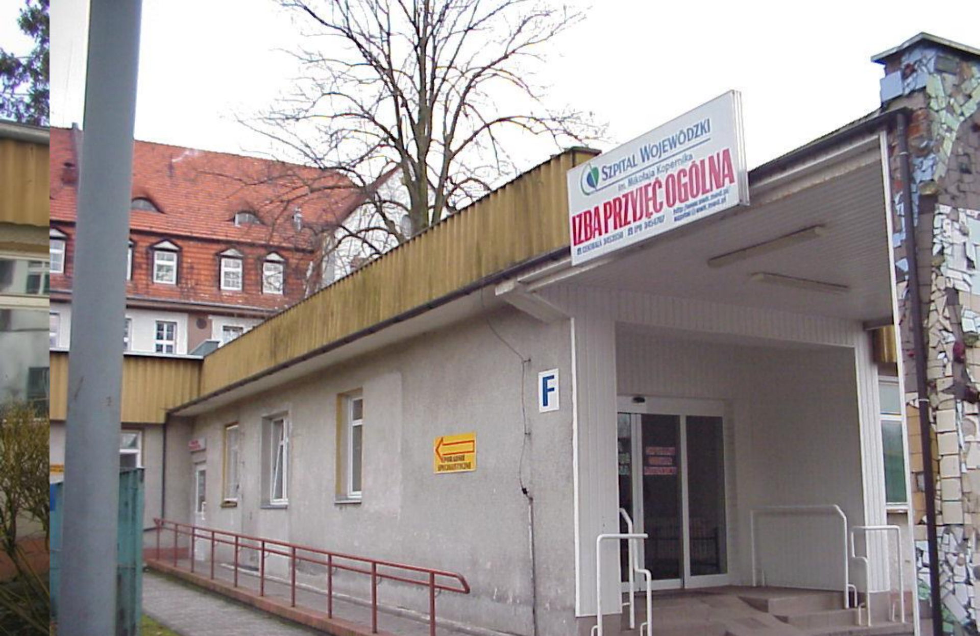
Szpitalny Oddział Ratunkowy – przed remontem