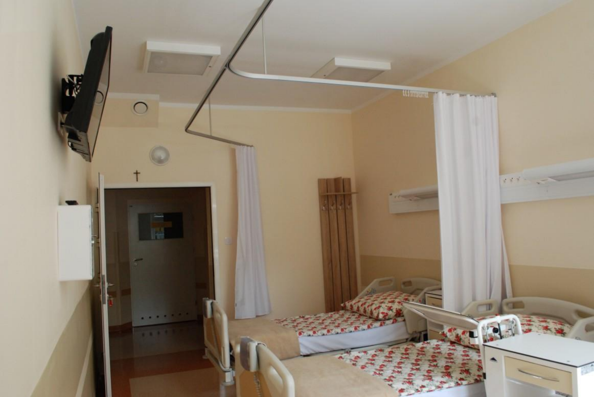
Sala chorych Oddziału Ginekologii