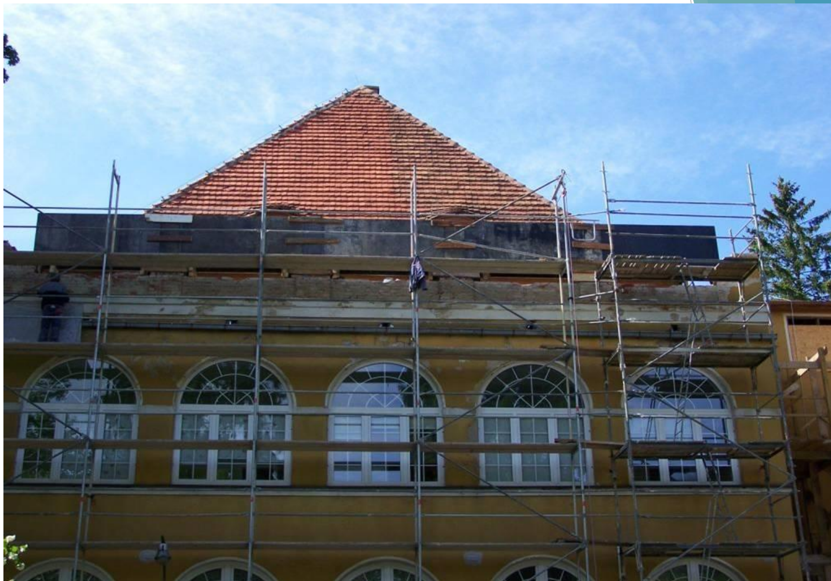
Oddział Patologii Cięży – przed remontem