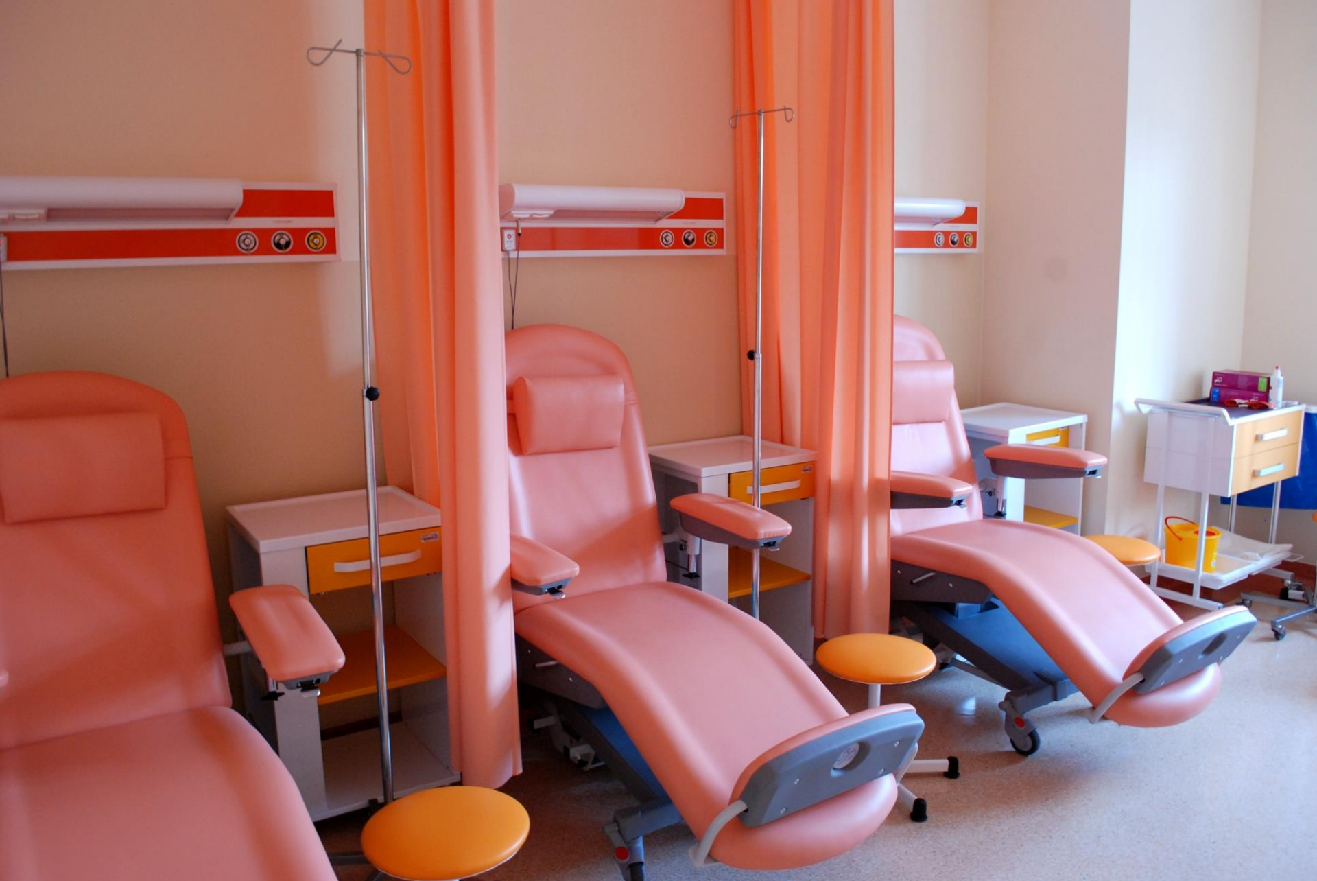
Sala chorych Oddziału Dziennego Chemioterapii