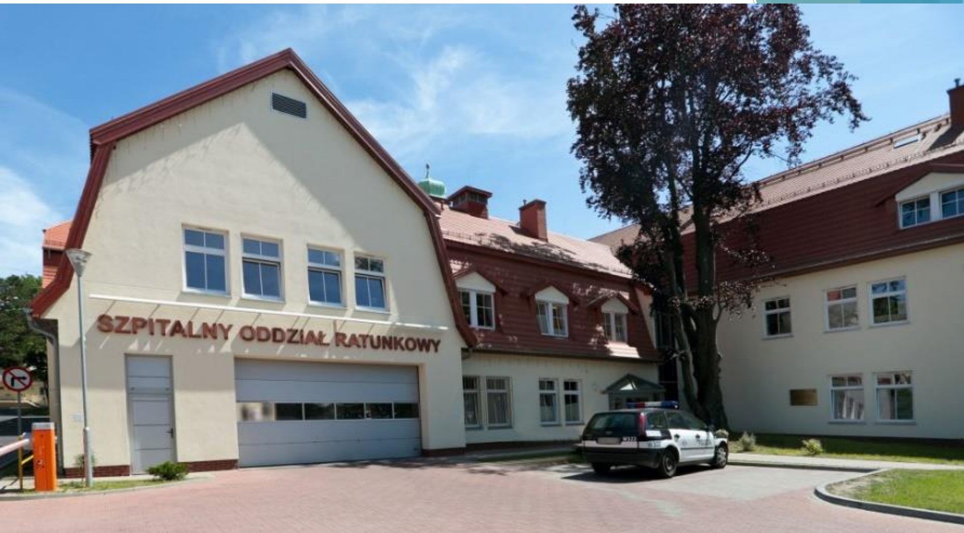
Szpitalny Oddział Ratunkowy