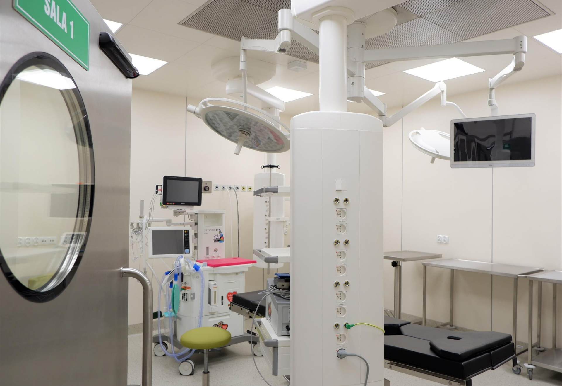
Blok Operacyjny – Chirurgia Dziecięca