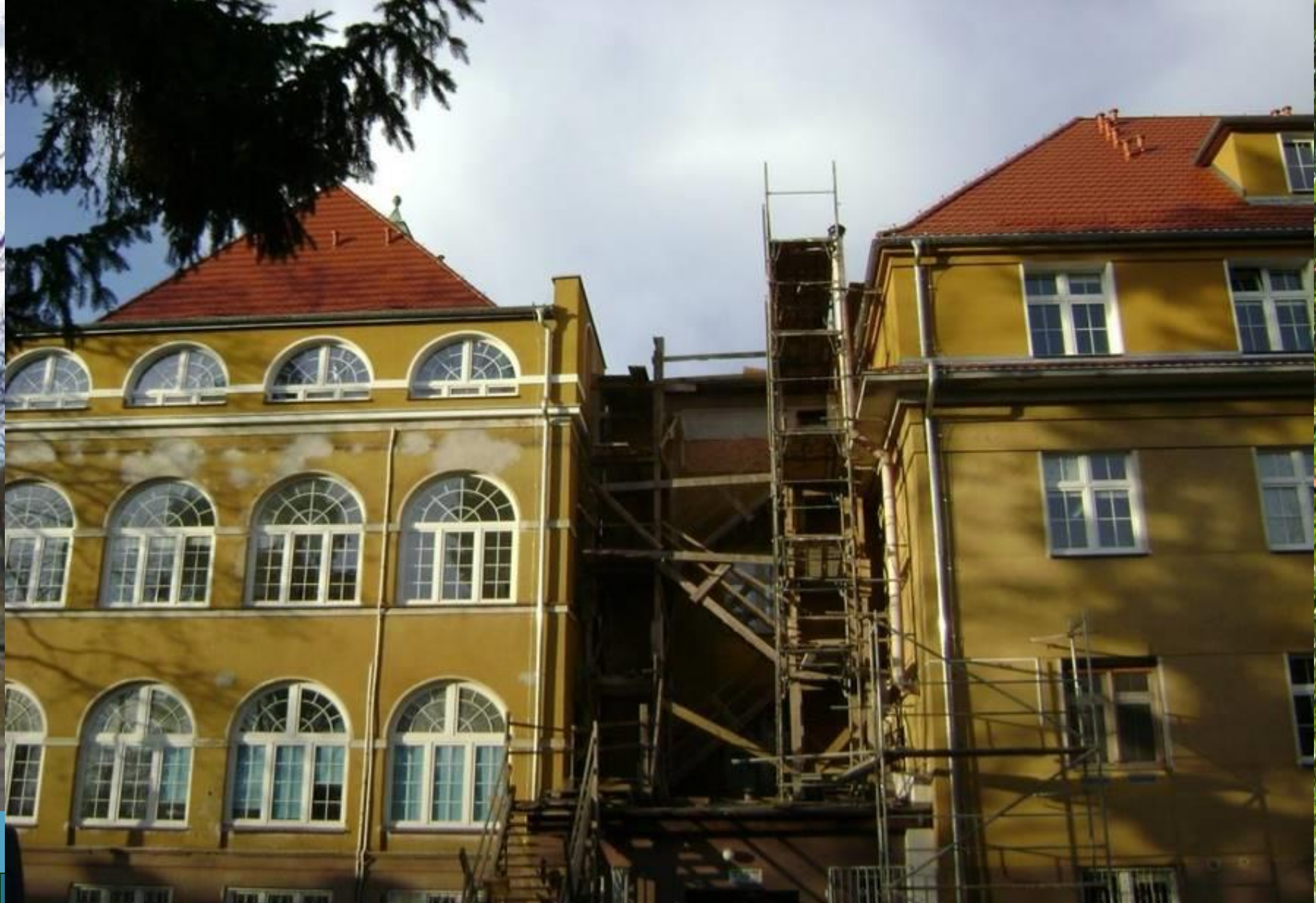
Budynki szpitala – przed termomodernizacją