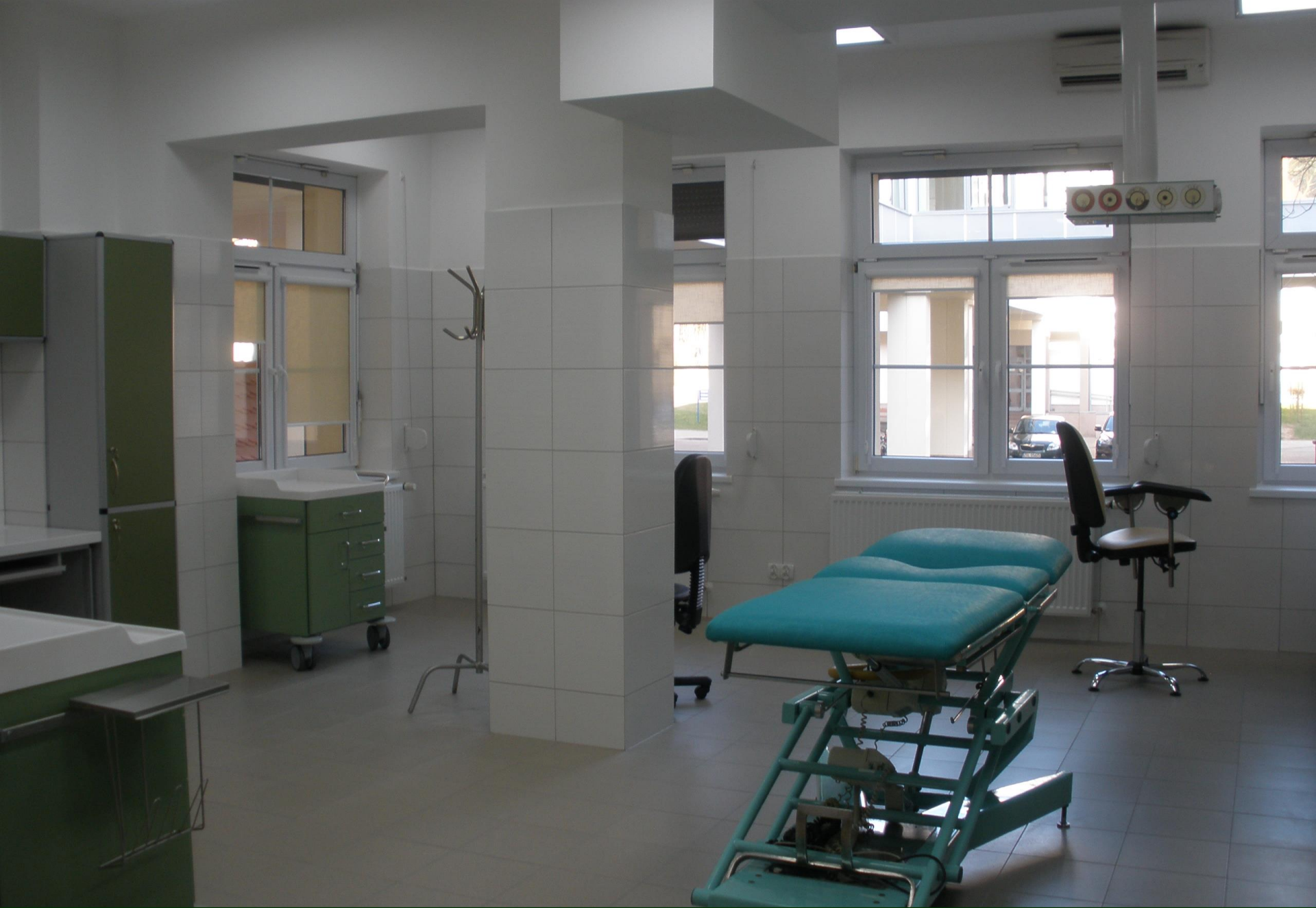
Sala zabiegowa Oddziału Urologii