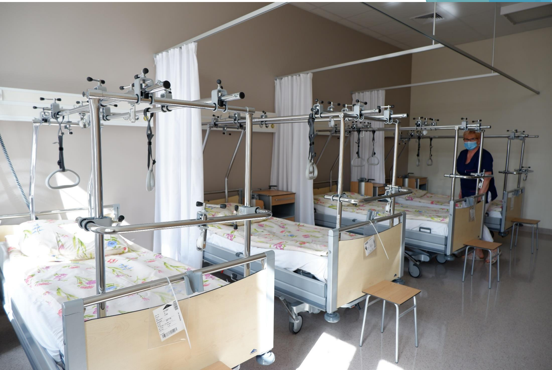
Oddział Chirurgii Urazowej i Ortopedycznej