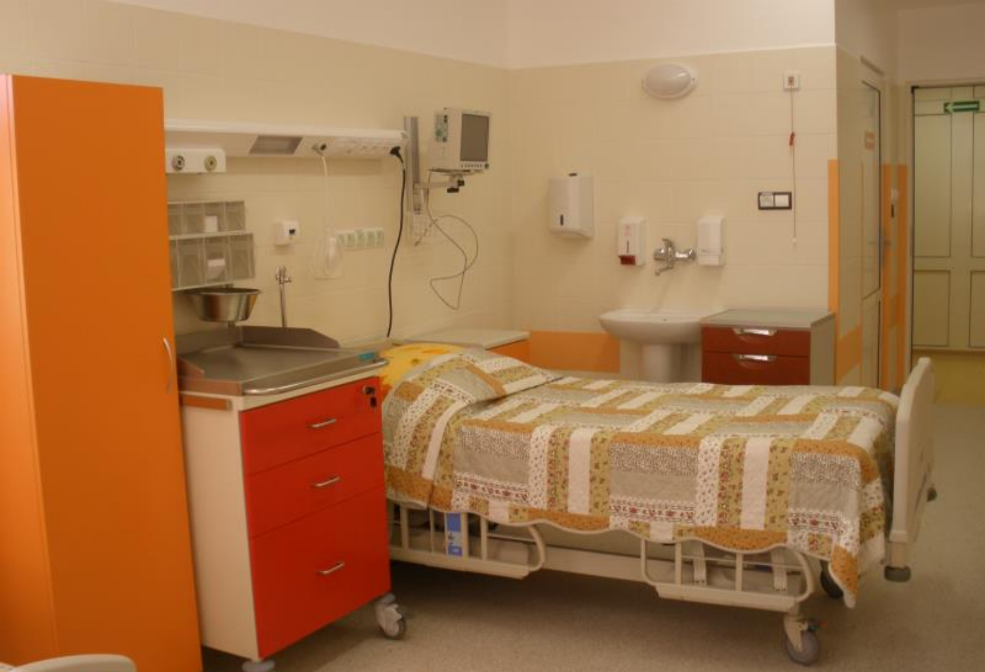
Sala chorych w Oddziale Patologii Ciąży