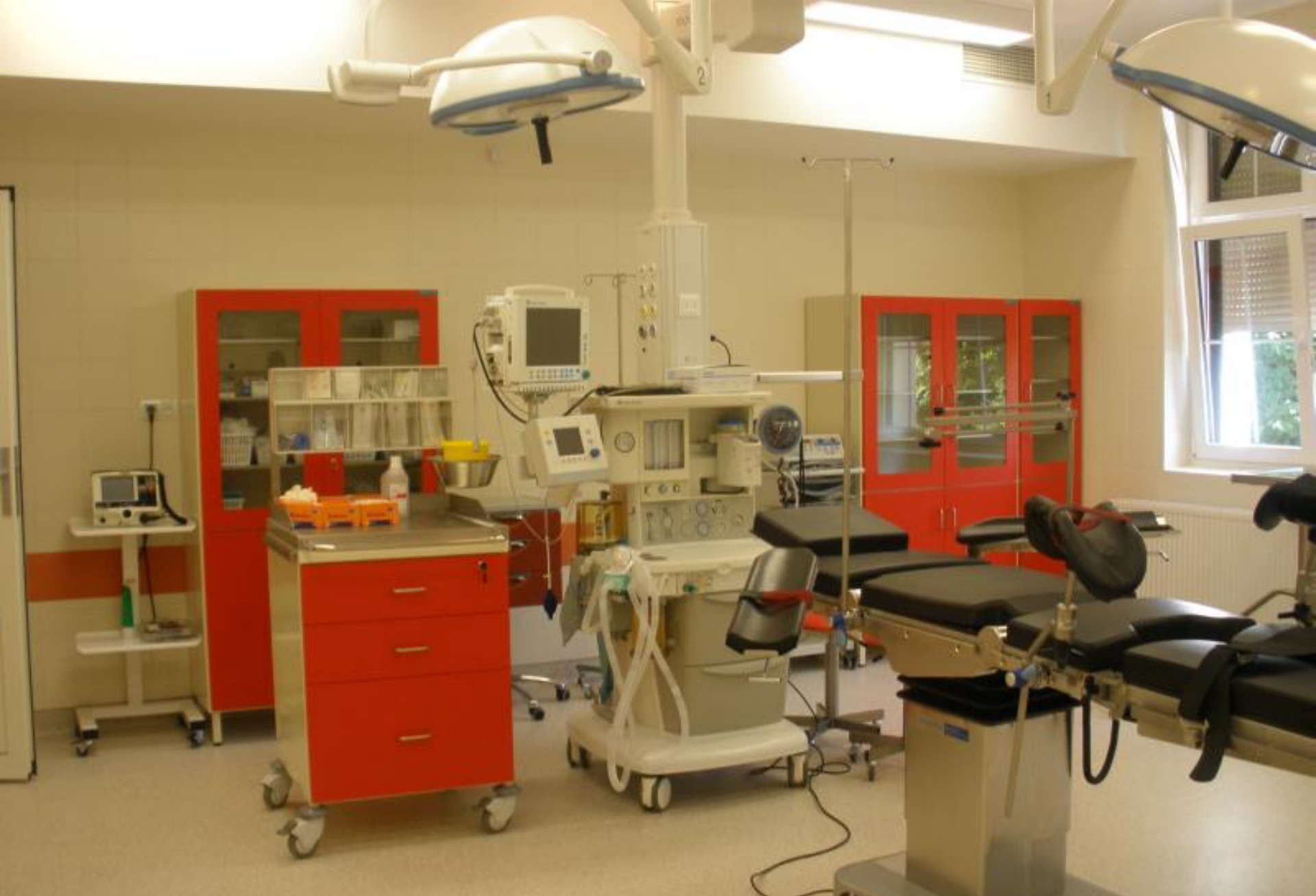
Sala operacyjna w Oddziale Patologii Cięży