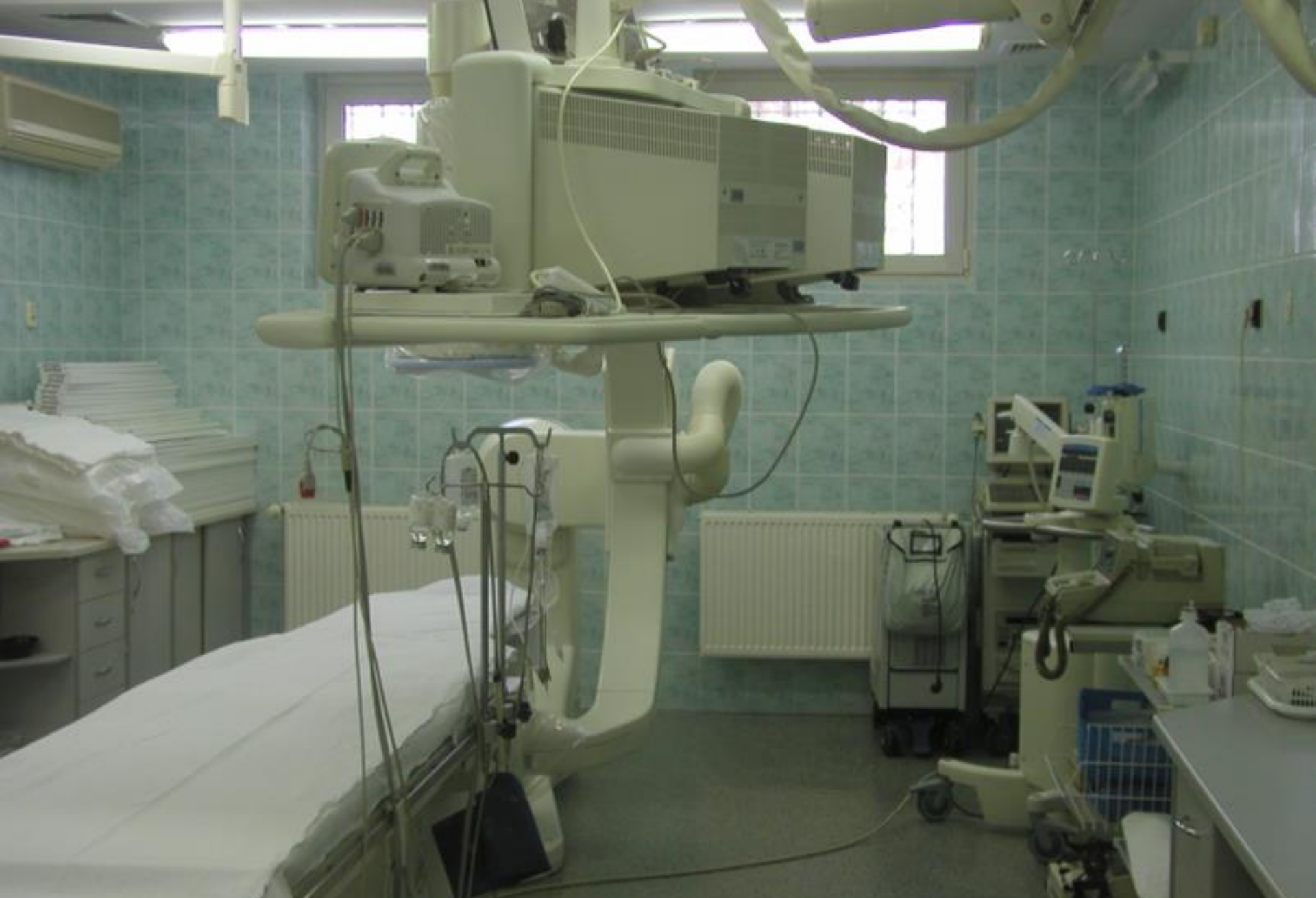
Pracownia Angiografii – przed remontem